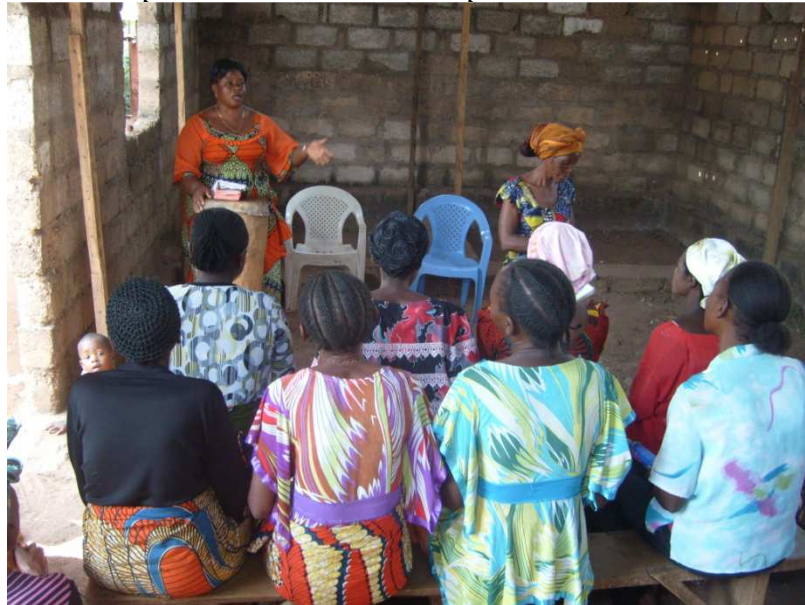
Le groupe des mamans de l'URCC/Mbuji-Mayi en réunion

Les Groupes de Mamans Reformées et des Jeunes ont bien fonctionné l'année passée. Ils ont organisé leurs élections pour un nouveau leadership en 2013.