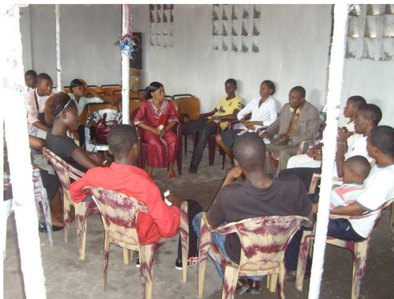
Les jeunes de la Paroisse de l'Amour en réunion

Les activités suivantes ont été réalisées pendant la deuxième moitié de 2012 :