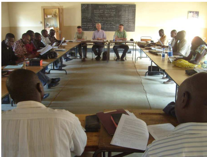
Session juillet 2012 FTE Lubumbashi