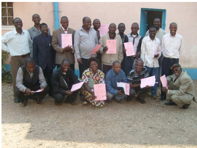
Les étudiants de l'Ecole Biblique de Lubumbashi posant lors de la clôture de la session 2012