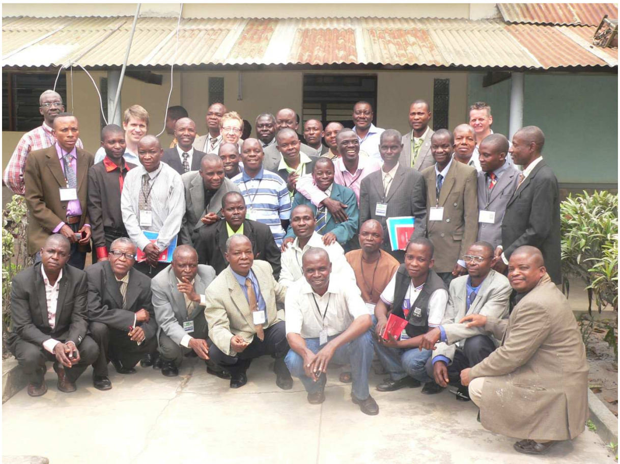
Les délégués au Synode Général de l'U.R.C.C. à Kananga en juillet 2012