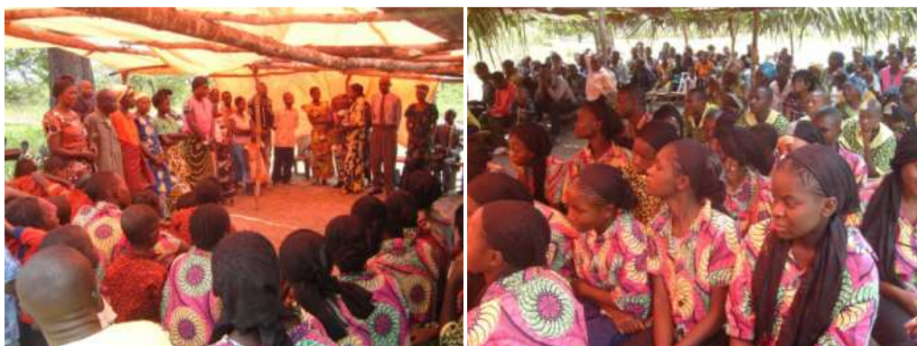
Culte communautaire et Profession publique de la foi à Nkonda (Consistoire de Kolwezi)